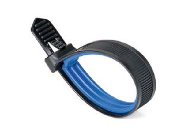
Soft Grip kabelbinder (2-komponent kabelbinder)