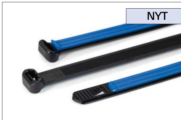
Soft Grip kabelbinder (2-komponent kabelbinder)